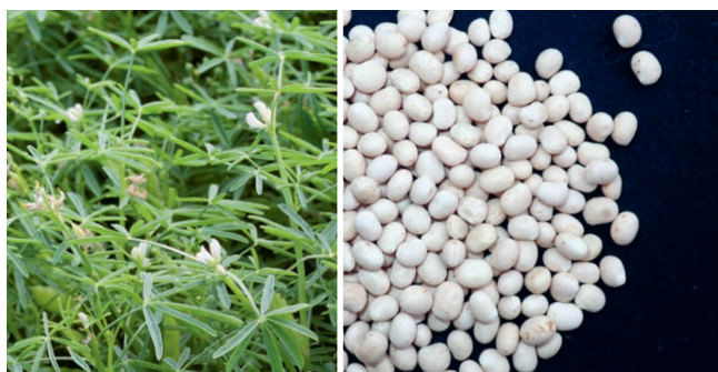
Les lupins à folioles étroites peuvent être produits en cultures pures ou associées. Les graines sont sphériques ou ovoïdes.