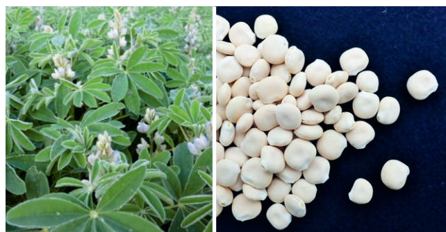
Les lupins blancs peuvent être produits en cultures pures. Les graines sont des disques aplatis.

de culture qui soit meilleure que la culture pure, il faut malheureusement encore s'attendre au moins jusqu'à la mi-août à des invasions tardives de mauvaises herbes dues à la lente maturation du lupin blanc.